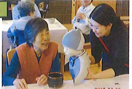
生け花教室 秋のお茶会の様子