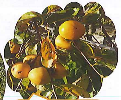
実りの秋。 春の森から正面の柿の木にも沢山の実りが♪